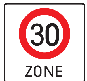
Tempo 30 Zone