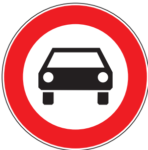
Verbot für Kraftfahrzeuge