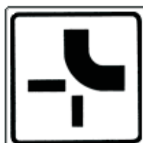
Verlauf der Vorfahrtstraße