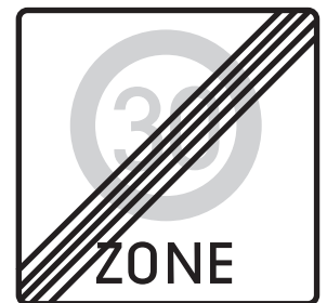
Ende Tempo 30 Zone