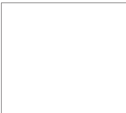
Modell eines Wasser-Moleküls

Farbe: _____ Geruch: _____ Aggregatzustand: _____ schwerer / leichter als Luft _____ brennbar: _____ Element / Verbindung: _____ chemisches Zeichen: _____